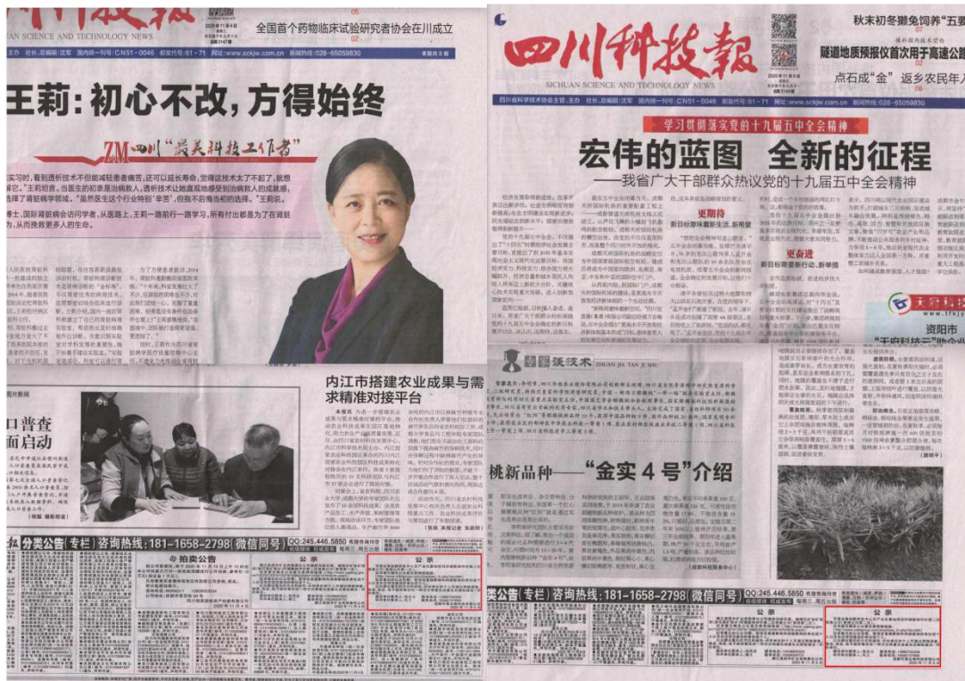
图3-2 2020年11月4日以及2020年11月6日四川科技报公示截图