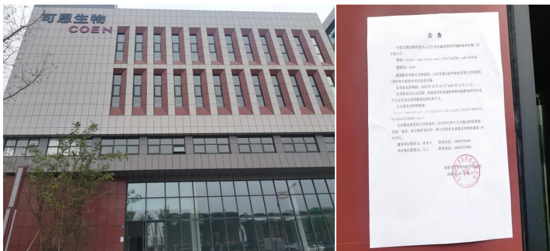
图3-4 项目所在地公示张贴照片