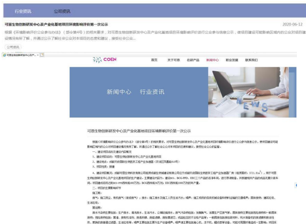
附图2-1 成都可恩生物科技有限公司官方网站第一次网络公示截图